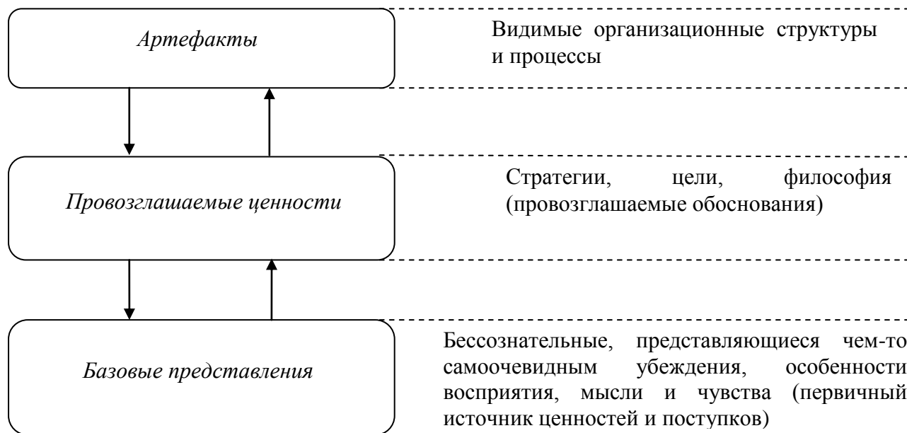
Рис. 1. Уровни культуры по Э.Шейну.

Понятие «ментальность» имеет достаточно широкое толкование: социальное мышление (К.А. Абульханова-Славская), «объективированная человеческая активность в единстве с порождённым ею» (В.А. Шкуратов), групповое сознание в пространстве и времени (Г.В. Акопов, Т.В. Иванова, Т.К. Рулина), критериальная основа личностного и общественного сознания (Б.С.Гершунский), система норм поведения (И.Г. Дубов), национальный характер (Н.О. Лосский), социальные представления (С. Московичи), интегративное личностное образование, носящее групповой характер и отражающее специфику отношений к миру (Д.В. Оборина), мотивы, предпочтения (В.А. Сонин), способ восприятия действительности (Е.В. Гончарова) и др.